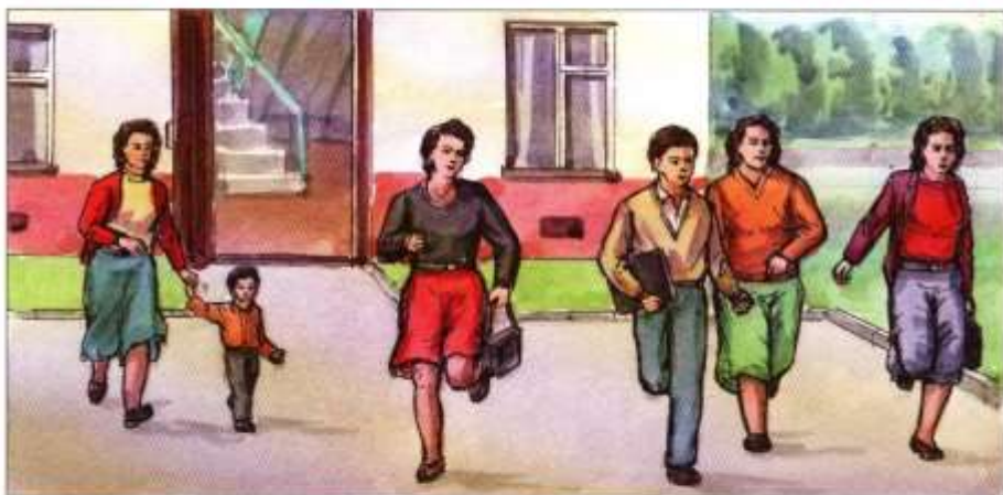
Быстро покинуть здание (в вашем распоряжении 15 — 20 секунд)

ПОЛУЧИВ ИНФОРМАЦИЮ ИЛИ ПОЧУВСТВОВАВ ПЕРВЫЕ ТОЛЧКИ, НЕОБХОДИМО: