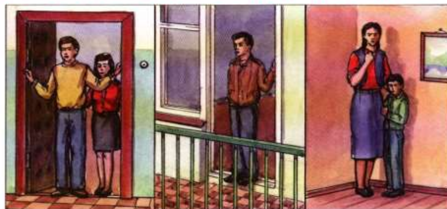
На втором и последующих этажах встать в проем входной или балконной двери, отойти от окон и занять место в углу, образованном капитальными стенами