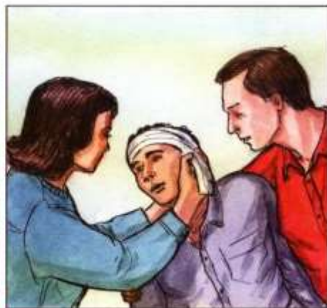
Оказать первую помощь пострадавшим